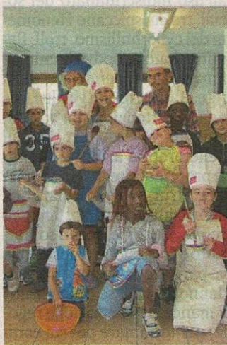
IL PROGETTO L'OBIETTIVO È COSTRUIRE UN PERCORSO SULL'ACCOGLIENZA

Una ricorrenza che l'associazione ha scelto di festeggiare attraverso un'installazione